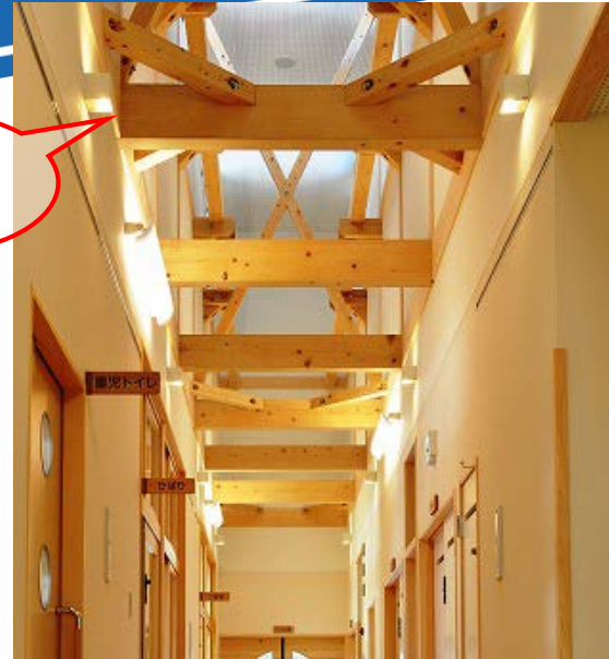
《接着重ね梁の利用事例》

長野県産材の利用拡大を図るために、信州木材認証製品センターと県林業総合センターが共同で開発を進めてきた「信州型接着重ね梁」が、建築基準法に基づき国土交通大臣の認定を受けました。この認定取得により、外材の使用割合が高い梁・桁材において県産材のシェア拡大が期待されます。