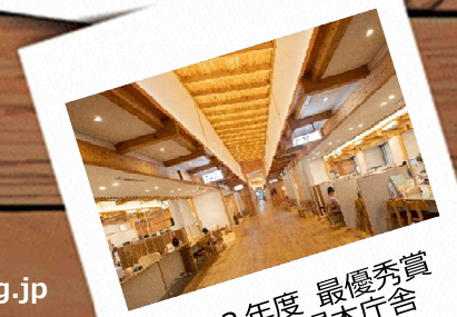
令和3年度 最優秀賞 木曾町役場本庁舎