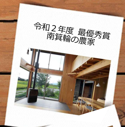
令和2年度 最優秀賞 南箕輪の農家